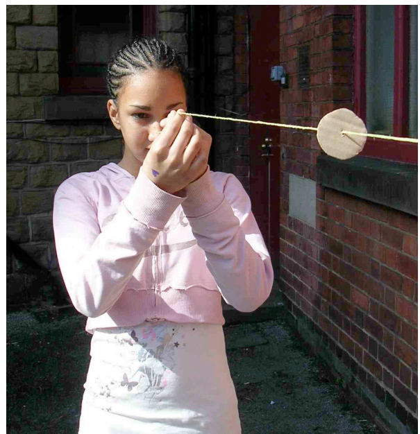
Den „Mond“ benutzen, um „die Sonne“ zu verdecken

Antworten: Kopf der Person, Daumen, Auge