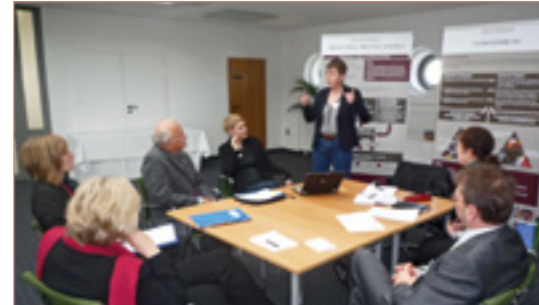
Projektpräsentationen am Vormittag