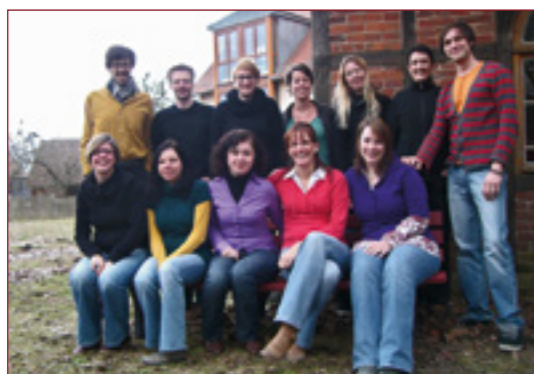
Die »NaWis« während der Winterschool im Februar 2011

Im Jahr 2011 hat das GEI sein Konzept zur Nachwuchsförderung um einige neue Instrumente erweitert. So stand den Promovierenden und Postdoktoranden erstmals ein eigenes Budget für Fortbildungen, Tagungsteilnahmen und Veranstaltungen zur Verfügung. Außerdem schließen nun die institutsinternen Betreuer mit allen Doktoranden individuelle Promotionsvereinbarungen ab, die einen strukturierten und transparenten Rahmen gewährleisten. Im Laufe des Jahres 2011 haben sich die Nachwuchswissenschaftler des GEI durch regelmäßige, selbständig organisierte Veranstaltungen ihres »Nawi-Forums« fest im Institut etabliert. Die Gruppe widmete sich sowohl dem internen Austausch über Forschungsprojekte und -perspektiven als auch der Vernetzung und der Nachwuchsarbeit im GEI. Die zwei gewählten Sprecher vertreten den wissenschaftlichen Nachwuchs im Institut und sind in verschiedene Gremien – auf der Ebene ihrer Arbeitsbereiche oder institutsübergreifend wie etwa dem Forschungs-