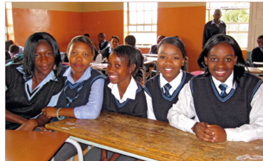
Junge Südafrikanerinnen einer Geschichtsklasse in Johannesburg

Umgang mit Apartheid in der südafrikanischen Unterrichtspraxis