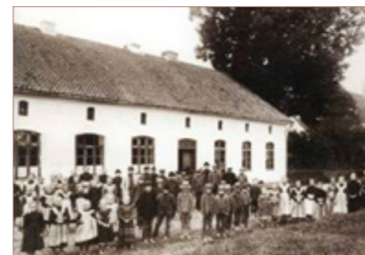
Kinder vor dem Schulhaus in Plauten

Zentrales Produkt ist in seiner ersten Förderperiode bis September 2012 eine wissenschaftliche Monographie zum »Pruzenland«, die eine qualitative Schulbuchanalyse mit Forschungen zu Erinnerungskultur, Bildungspolitik und Historiographieggeschichte verknüpft. Angestrebt für die zweite Förderperiode ist der Aufbau einer multilingualen Open Access Internetedition von