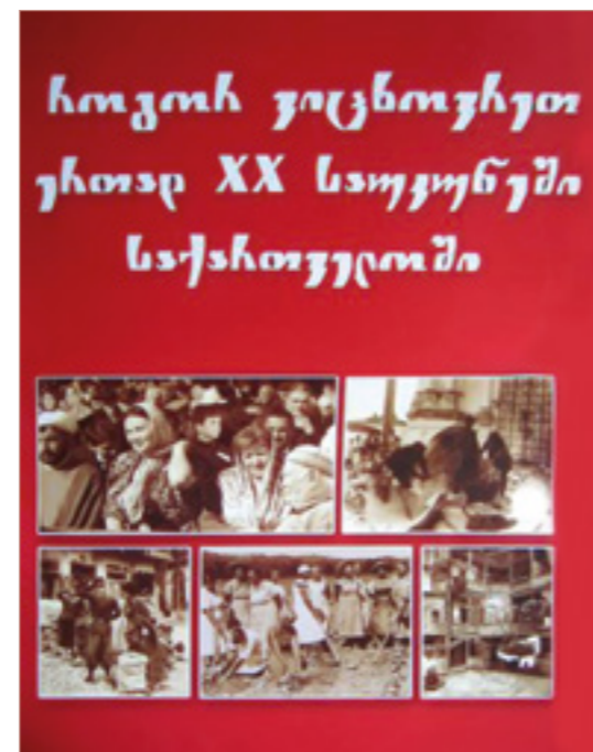
Handreichungen für die Schulpraxis

Im vergangenen Jahr beauftragte die European Association of History Educators (EUROCLIO) das GEI, die in dem Projekt »Tolerance Building through History Education in Georgia« entstandenen Unterrichtsmaterialien zu evaluieren. Diese waren – unter dem Titel »How we lived together in Georgia in the 20th Century« – von georgischen Spezialisten er-