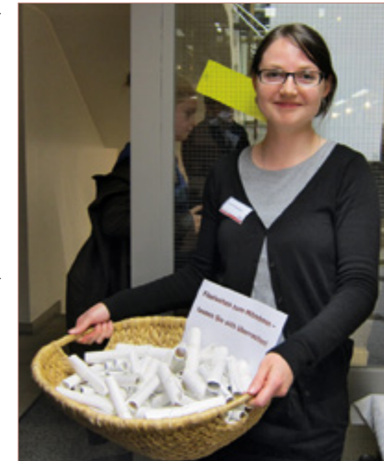
Beim Tag der offenen Tür »Treffpunkt Bibliothek« wurden »Fibelseiten zum Mitnehmen« angeboten

Auf diese Weise entsteht am GEI ein einmaliges Angebot, das der Schulbuchforschung erstmalig Lehrpläne in optimaler Weise zur Verfügung stellt. Das Projekt markiert einen weiteren Schritt im Rahmen der Entwicklung zur hybriden Forschungsbibliothek.