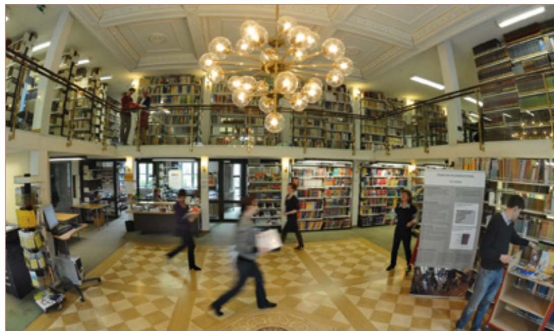
In der Forschungsbibliothek stehen Bücher aus 160 Ländern der Welt bereit

Aufbau einer Curricula-Workstation mit Zugang zu deutschen und internationalen Lehrplänen