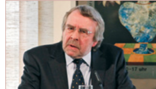
Der Bildungshistoriker Heinz-Elmar Tenorth beim Festakt