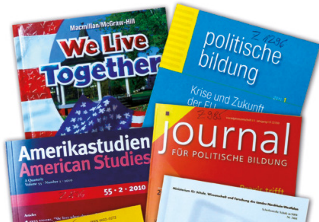
Fallstudien in NRW und Schleswig-Holstein zum Politikunterricht