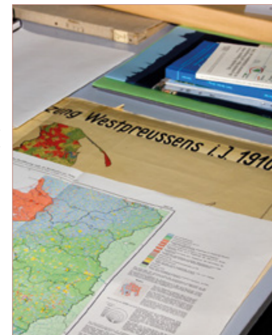
Arbeitsfeld »Europa im Prisma der Regionen«