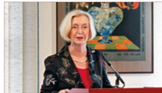
Die niedersächsische Ministerin für Wissenschaft und Kultur, Johanna Wanka, beim Festakt zur Aufnahme in die Leibniz-Gemeinschaft