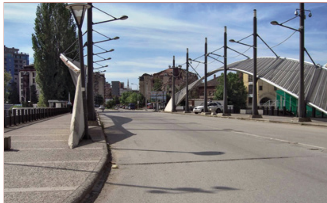
Mitrovica, Kosovo – Grenze zwischen Albanern und Serben

Ein Teilprojekt, das sich mit den albanischsprachigen Gebieten der Region beschäftigt, ging der Frage nach der gegenwärtigen Situation in der Curriculum- und Schulbuchentwicklung für das Unterrichtsfach Geschichte nach. Über 130 Schulbücher wurden im Hinblick auf Nation-Staat-Ethnie-Bezüge und auf die Repräsentation der interethnischen Beziehungen hin untersucht. Divergierende Geschichtsinterpretationen erreichen in Südosteuropa noch immer ein hohes Ausmaß. Allen Schulbüchern eigen ist das Bestreben, sich durch die Behandlung von Themen der Politikgeschichte in internationale Prozesse bei strikter Wahrung der nationalen Komponente einzuordnen. Selten wird auf eine differenzierte Sichtweise von Sachverhalten hingewiesen. Darüber hinaus zeigen albanische, makedonische und serbische Lehrwerke fortgesetzt eine starke transnationale Komponente. Auch nationale und religiöse Mythen, die nicht nur aus der älteren Geschichte tradiert, sondern auch neu geschaffen werden, finden sich häufig