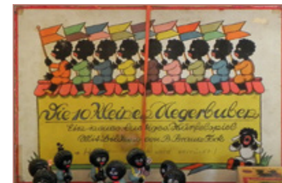
»Zehn kleine Negerlein«

Pressekonferenz im Auswärtigen Amt zur Studie »Keine Chance auf Zugehörigkeit? Schulbücher europäischer Länder halten Islam und modernes Europa getrennt«