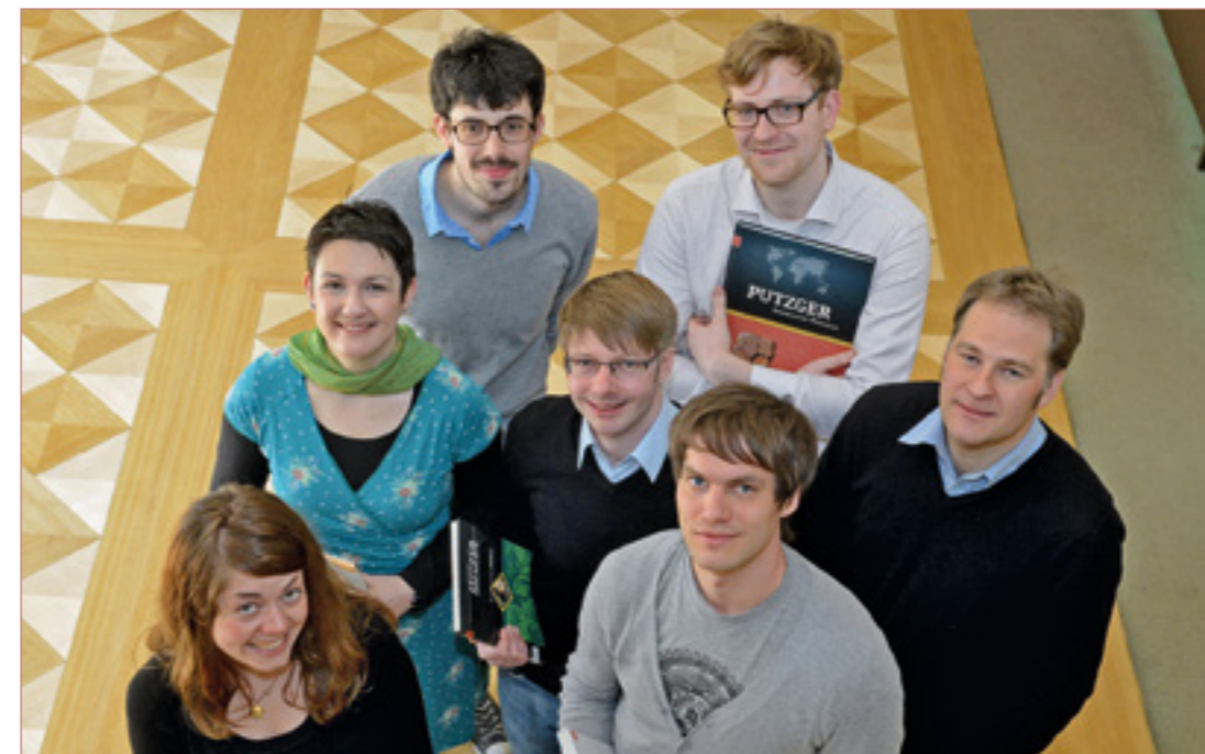
Eine Gruppe von Nachwuchswissenschaftlern am Georg-Eckert-Institut. Die »NaWis« bringen sich auf vielfältige Weise in die Arbeit des Instituts ein.

Teilnahme von Nachwuchswissenschaftlern des Instituts am Doktoranden-Forum der Leibniz-Gemeinschaft