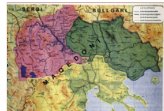
Karte aus einem mazedonischen Schulbuch

Netzwerkprojekte zu Konflikt-Kontexten von Schulbüchern