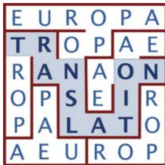
Gemeinsam mit dem ZZf in Potsdam und der Universität Kassel untersuchte das GEI in dem Projekt »Lost in Translation?« unterschiedliche Darstellungen von Europa.