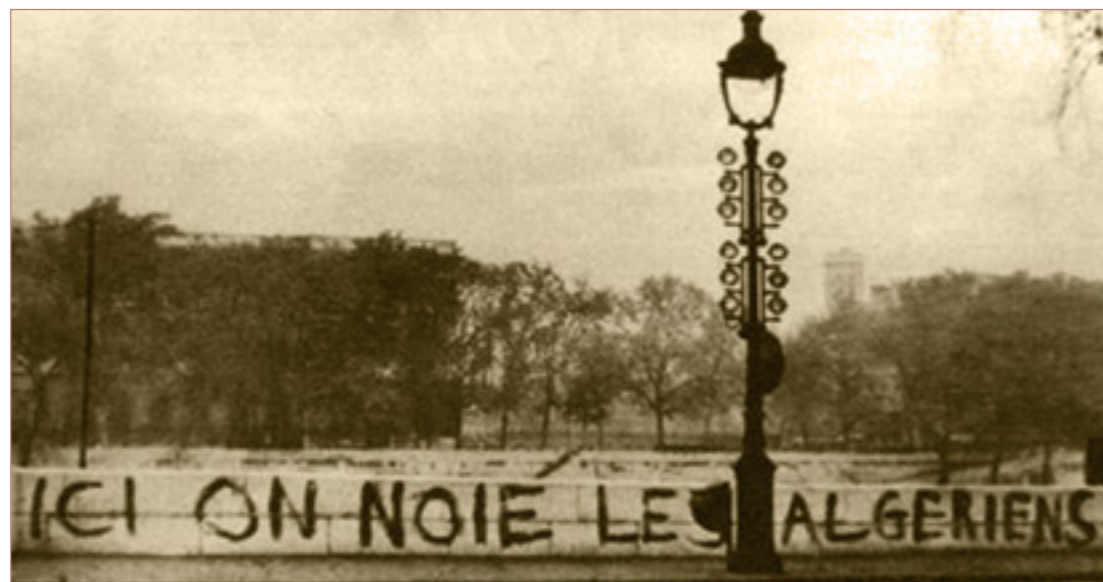
Die Präsenz kolonialer Konflikte in der Metropole (»Hier ertränkt man die Algerier«)

Postkoloniale Erinnerungspolitik in Frankreich