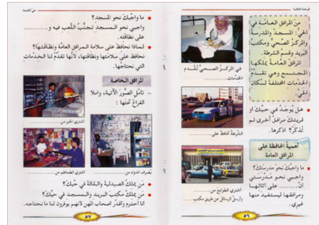
Auszug aus einem jemenitischen Schulbuch

Unterschiedliche internationale Akteure als Ideologie- und Geldgeber