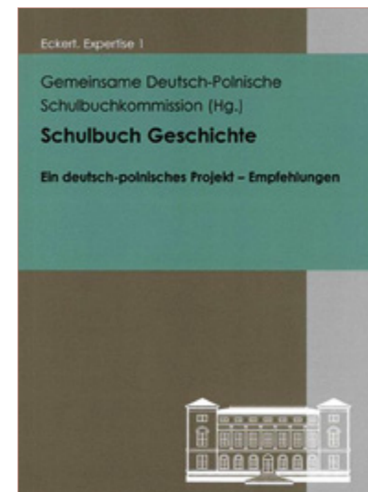
2012 erscheinen die inhaltlichen Empfehlungen für ein gemeinsames deutsch-polnisches Geschichtsbuch. 2015 wird das Lehrwerk im Unterricht beider Länder einsetzbar sein.

sität Braunschweig laufenden Projekt »European Icons« ist es gelungen, Bilder Europas in europäischen Schulbüchern des 20. Jahrhunderts in die Edition einzubeziehen. 2011 wurde das gemeinsam von der Deutschen Forschungsgemeinschaft und dem L'Agence Nationale de la Recherche (ANR) geförderte Projekt »Konkurrenz und Konvergenz: Europabilder in deutschen und französischen Schulbüchern von 1900 bis zur Gegenwart« erfolgreich beendet. Die entstandene Quellenedition zu Europawahrnehmungen in diesen beiden Ländern wird zugleich einen Bestandteil von »EurViews« bilden. Sie wurde auf der Abschlusskonferenz, die in der Niedersächsischen Landesvertretung Brüssel gemeinsam mit dem »Centre de recherches interdisciplinaires en sciences humaines et sociales« (CRISES) vom 1. – 3. März 2011 stattfand, vorgestellt und fand große Resonanz.