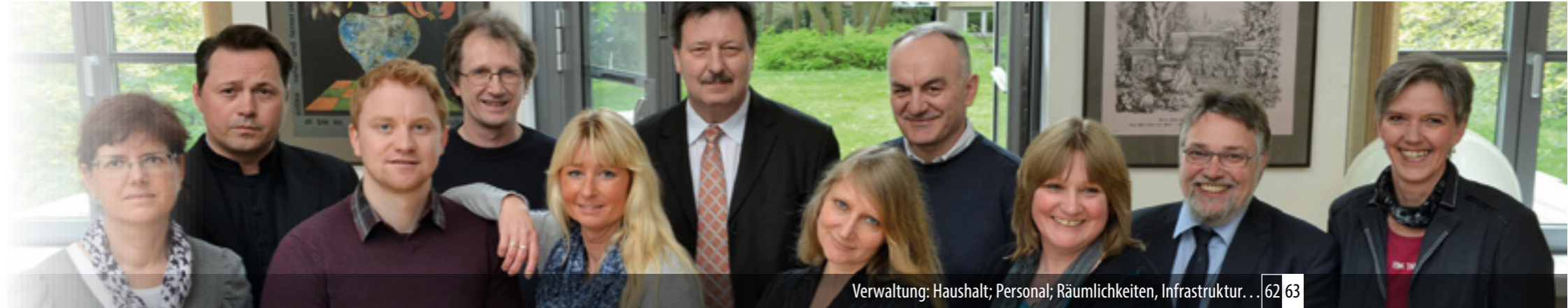
Verwaltung: Haushalt; Personal; Räumlichkeiten, Infrastruktur. . . 62 63