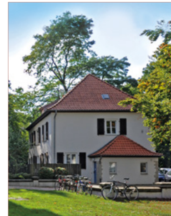
Stipendiatenwohnungen im Gästehaus des GEI

Kooperationen mit Partnern in und außerhalb der Leibniz-Gemeinschaft