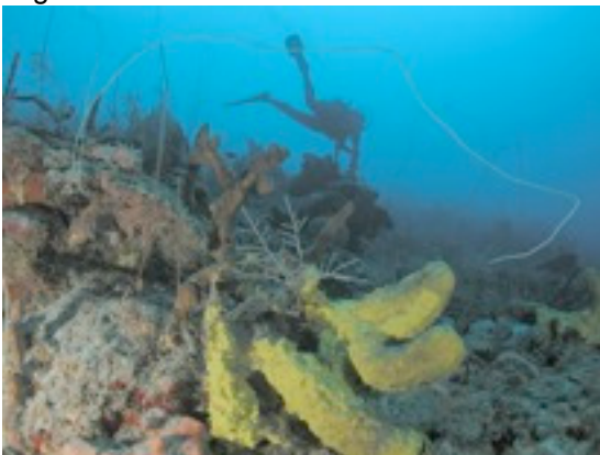
Taucher und Schwämme , Cane Bay wall, by Clark Anderson/ Aquaimages. Lizenziert unter: Creative Commons Attribution ShareAlike License version 2.5: http://creativecommons.org/licenses/by-sa/2.5/

Für einen Korallen-Kalkstein aus einem Korallenmeer, der in einer Umwelt wie der unten abgebildeten entstand, könnten die Antworten wie folgt ausfallen: