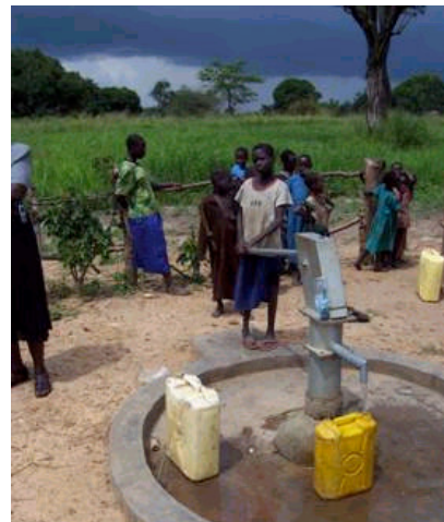
Ein Schachtbrunnen, der mit Hand betrieben wird, Obelai, Uganda

Löffels ein kleines Loch „bohren“, das sich sogleich mit Wasser füllen wird.