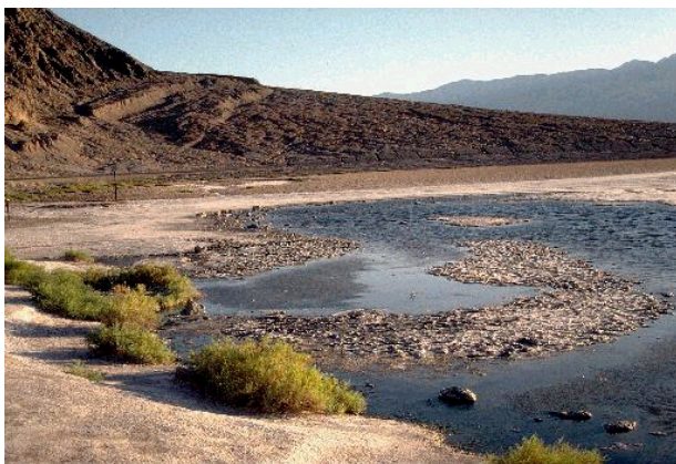
Eine natürliche Quelle im Death Valley, Kalifornien, USA

Gießen Sie beide Becher voll mit Wasser. Gleich darauf kann man an den Seiten des Plastikbehälters beobachten, dass der Sand nass wird und das Wasser „hangabwärts“ fließt. Fragen Sie die SuS, wo das Wasser wohl am ehesten an die Oberfläche kommt, während Sie weiter Wasser in die Becher gießen. Je nach dem wie tief die Becher in den Sand gesteckt wurden, wird das Wasser entweder in der Nähe der Becher oder am unteren Ende des Behälters erscheinen – in jedem Falle aber tritt das Wasser als „Quelle“ zutage (s. Foto). Irgendwann wird das Wasser über die Ränder des Behälters treten und in die Schale darunter fließen.